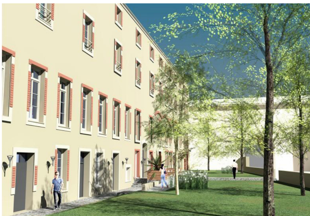
La résidence rue Frédéric-Suisse accueillera bientôt un tiers lieu.